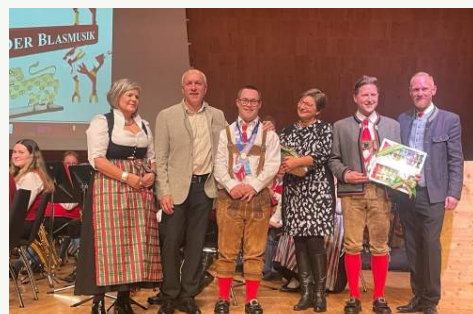
NEUIGKEITEN der Trachtenkapelle Flattach