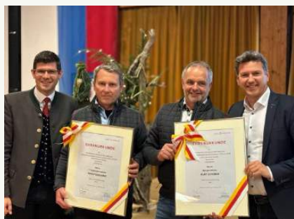
„Zom kemen—und zruck schau“