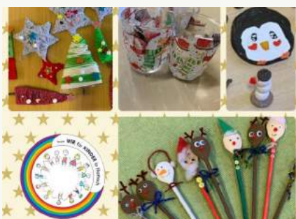
„Wir für Kinder in Flattach“