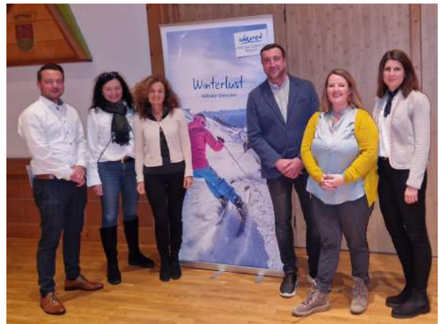
© TVB Mölltal: vlnr C.Vierbauch, GF Region P.Müllmann, G.Hartweger, GF MGB P.Nikl, Vortragende K.Faschauner, V.Loipold