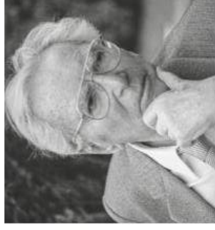
Viktor E. Frankl

mit Viktor E. Frankl-Ausstellung „Lebe(n) voll Sinn“ & Vorträgen