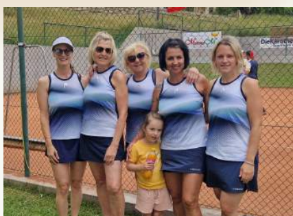
„Tennisclub Union Flattach“